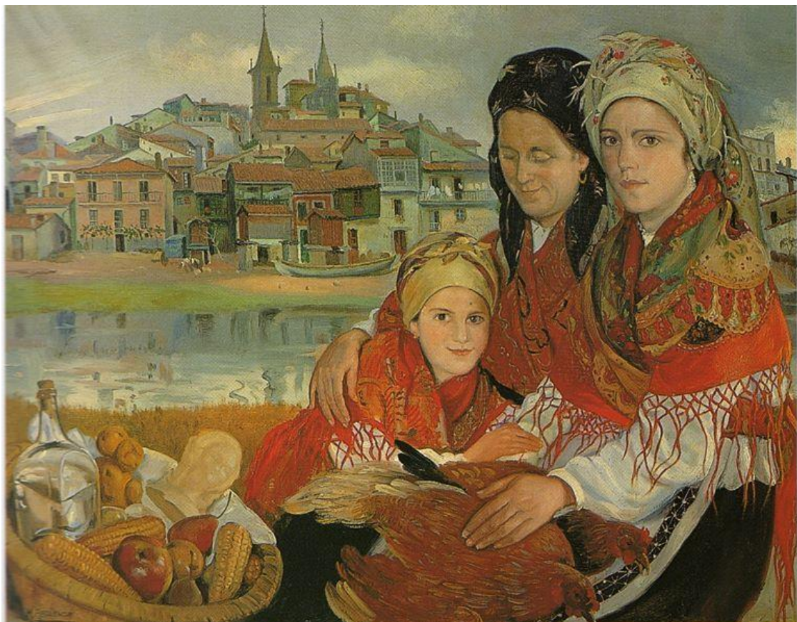
Romería en Betanzos, Óleo, Manuel Abelenda, 1945