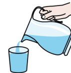
VERTER NO VASO